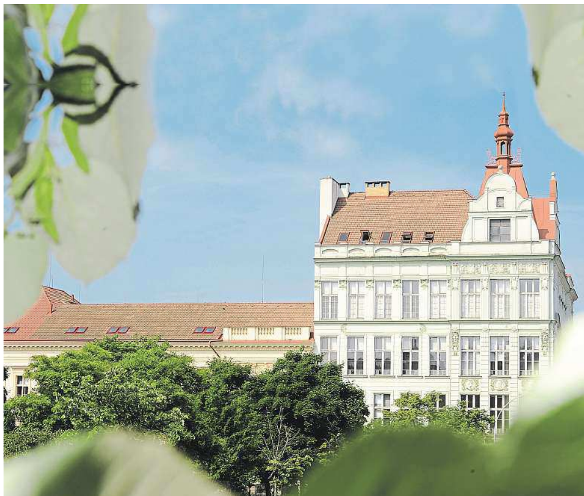
Sídlo Budova Vysoké školy finanční a správní v Praze.

VŠFS je jako jediná soukromá vysoká škola držitelem prestižního certifikátu ECTS Label. Certifikát ECTS Label je nejprestižnějším evropským oceněním v oblasti kvality terciárního vzdělávání, jeho získáním se VŠFS řadí k 11 renomovaným veřejným vysokým školám v České republice. Osvědčuje, že VŠFS splňuje náročná kritéria Evropské unie, a dokládá připravenost VŠFS plnit všechny mezinárodní závazky vyplývající z Boloňské deklarace.