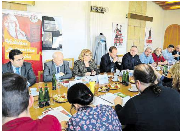
Nový začátek Tisková konference při vstupu VŠFS do Karlových Varů za účasti představitelů města a kraje

Velmi si podpory magistrátů měst Karlovy Vary a Most vážíme. V Mostě se jedná o dlouholeté partnerství, ve kterém stále hledáme další cesty, jak je zkvalitňovat a vzájemně obohacovat. S Karlovými Vary jsme v této spolupráci na samém začátku. Tisková konference, která se konala přímo na karlovarském magistrátu v únoru tohoto roku, naznačila, že i tady se nám podařilo začít v dobrém.