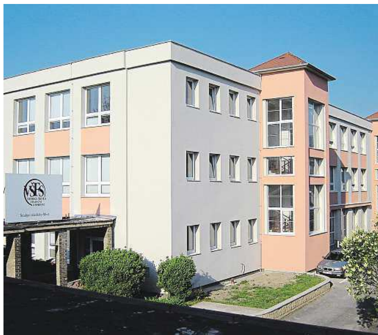
Budova studijního střediska VŠFS v Mostě

Celkové pojetí studia, kdy je klasická ekonomická teorie trvale doplňována aplikacemi z praxe, činí z celého oboru unikátní příležitost pro uchazeče, kteří po absolvování usilují o práci v obchodních nebo výrobních firmách, stejně jako v organizacích poskytujících služby.